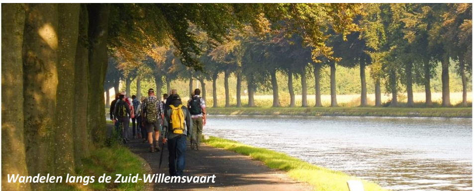
Wandelen langs de Zuid-Willemsvaart

Wie wil kan om 08.30 uur de eucharistie meevieren in de naast het hotel gelegen St.-Michielskerk. Via de Zuid-Willemsvaart en Bocholt bereiken we Priorij Klaarland van de trappistinnen en nemen deel aan een korte dienst. Na de picknickpauze aldaar gaan we via Hamont en de Warmbeek naar Achel-Statie, vlak voor de Belgisch-Nederlandse grens.