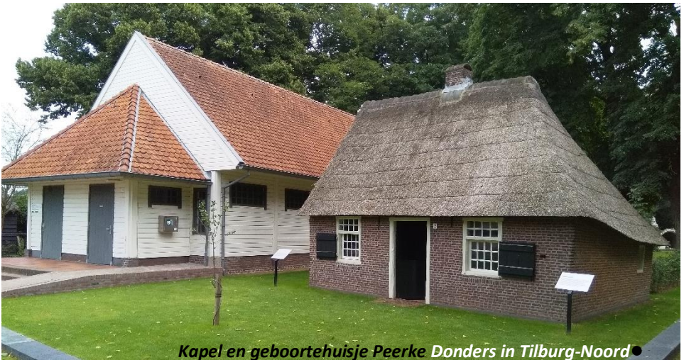
Kapel en geboortehuisje Peerke Donders in Tilburg-Noord ●

Langs vennen en door bossen en door Berkel-Enschot wandelen aan de noordkant Tilburg binnen. We sluiten de pelgrimstocht af in de Peerke Donderskapel en bezoeken nog zijn geboortehuisje en het Peerkepaviljoen, museum van naastenliefde. Met een lunch nemen we afscheid van elkaar.