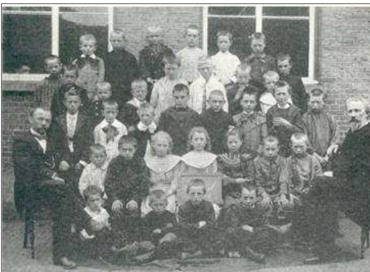
De oude Boxtelse schooljeugd